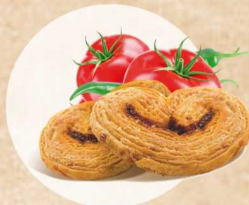
Feilletés tomate-piment Réf.014

Farine de blé (gluten), beurre (lait) 29,7%, fromage (lait) 17,3% (Emmental râpé 11,4% et Mimolette en poudre 5,9% dont oeuf), sel, levure, colorant : rocou.