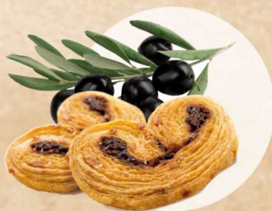
Feilletés olives noires Réf.015

Farine de blé (gluten), beurre (lait) 24,3%, emmental (lait), oignon en poudre 5,8%, vinaigre balsamique 2,9%, sel, huiles et graisses végétales (palme, colza, émulsifiant : mono et diglycérides d'acides gras, sel, acidifiant : acide citrique, colorant : \beta -carotène), sucre, levure, huile de colza, poivre noir, ail en poudre, colorant : rocou.