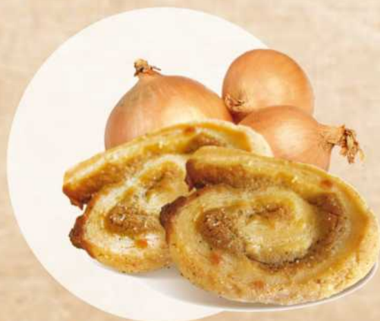
Feilletés confit d'oignons Réf.024

Farine de blé (gluten), beurre (lait) 29%, emmental (lait), sel, huile de colza, levure, poudre de tomate 0,45%, poudre de piment doux et fort 0,41%, poudre de coriandre et de cumin, mélange d'herbes avec de l'ail et de l'oignon, poivre noir, colorants : E160b et E160c.