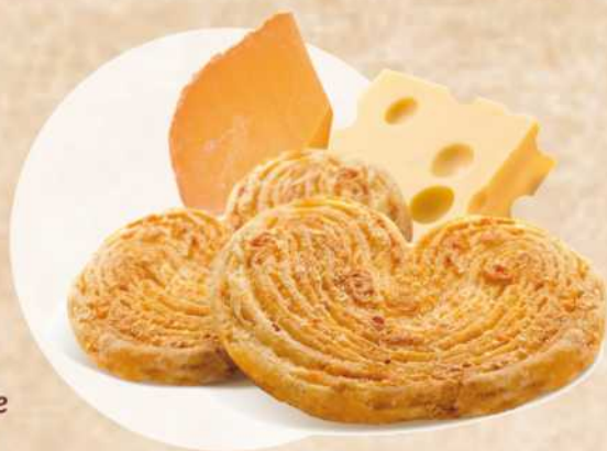
Feilletés fromage Réf.016

Farine de blé (gluten), beurre (lait) 26 %, emmental râpé (lait), huile de colza, ail en poudre 3,6%, sel, levure, persil déshydraté 0,7%, poivre noir, colorant : rocou.