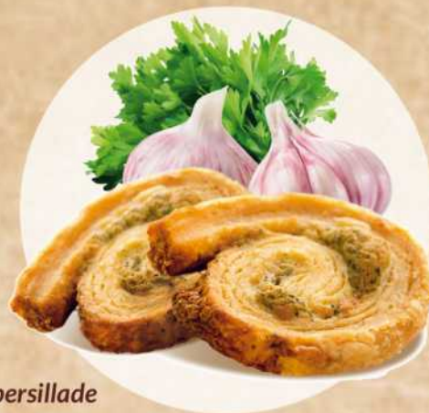
Feilletés persillade Réf.017

TOUS NOS FEUILLETÉS 7,00 € soit 29,17 €/Kg La boîte